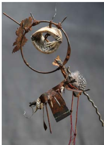
Kickema, Berlin 2015, sculpture mixed media (32 x 25 cm)