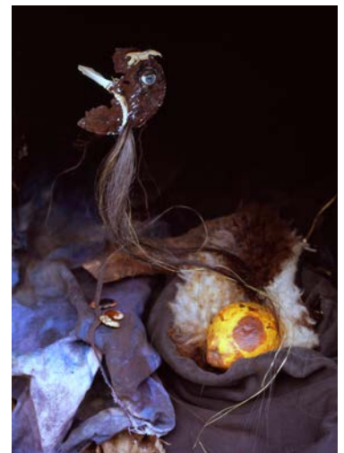
L'une grêle, le devenir, Berlin 2012, Chromogenic Print (30 x 40 cm)