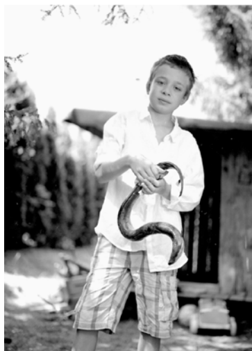
Zeno, Nötsch 2013, Chromogenic Print (30 x 40 cm)