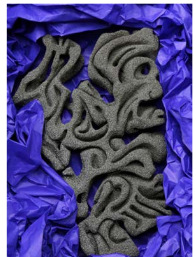
Initial I, Berlin 2015, Sculpture en pierre ponce (25 x 40 cm)