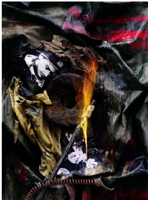
Spitz im Augen